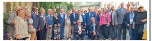
Alcuni dei rotariani che hanno partecipato all'Institute e, sotto, la visita all'ambulatorio "Catania Salute e Solidarietà onlus"

Conclusi i lavori dell'assemblea internazionale che ha visto la presenza di 400 membri provenienti da 17 Paesi europei