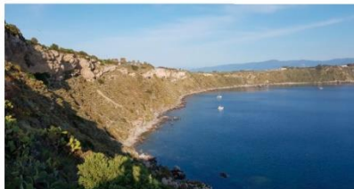
Sarà una fine settimana particolarmente intensa, a Milazzo. Due gli appuntamenti, uno dedicato all'Area Marina Protetta mentre l'altro si incentrerà sul MuMa e sull'importanza di tutelare i cetacei del nostro mare.

Salvatore Di Trapani | giovedì 16 Gennaio 2020 - 15:09