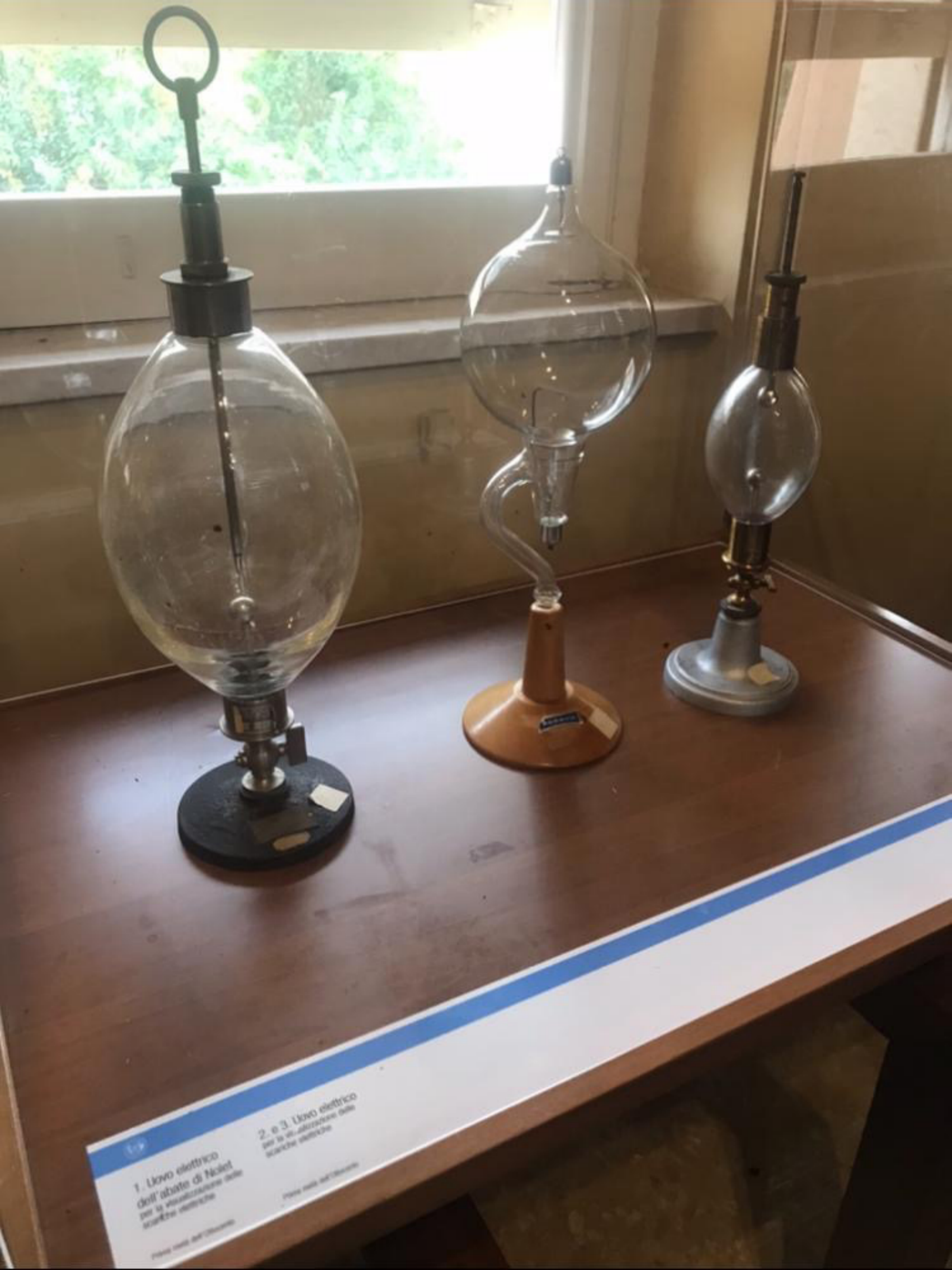
1. Liovo elettrico dell'abate di Nollet per la visualizzazione delle scariche elettriche