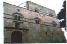
Palazzo Steri Palermo

Una scena disarmante è quella che quasi giornalmente ci ritroviamo davanti agli occhi guardando i servizi dei telegiornali nazionali e locali. Centinaia di Uomini donne e bambini che sbarcano nella nostra Isola alla ricerca di un futuro che dia dignità alla loro condizione umana.