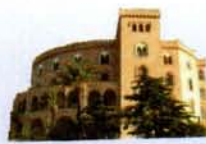
Castello Utveggio Palermo