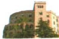
Castello Utveggio Palermo