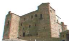
Castello Ventimiglia Castelbuono

Conosci te stesso per abbracciare l'umanità