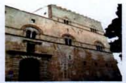
Palazzo Steri Palermo