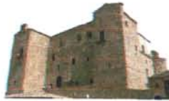
Castello Ventimiglia Castelbuono

Conosci te stesso per abbracciare l'umanità