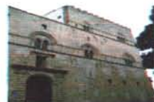
Palazzo Steri Palermo