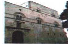
Palazzo Steri Palermo