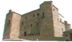
Castello Ventimiglia Castelbuono

Conosci te stesso per abbracciare l'umanità