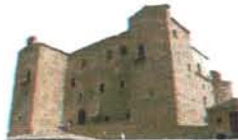
Castello Ventimiglia Castelbuono

Conosci te stesso per abbracciare l'umanità