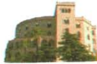
Castello Utveggio Palermo