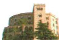
Castello Utveggio Palermo