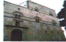
Palazzo Steri Palermo