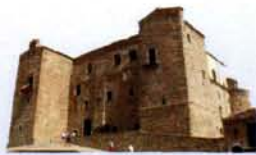
Castello Ventimiglia Castelbuono

Conosci te stesso per abbracciare l'umanità