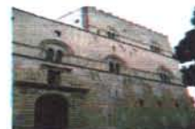
Palazzo Steri Palermo