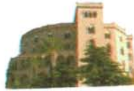
Castello Utveggio Palermo