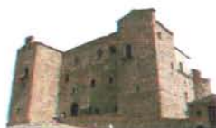
Castello Ventimiglia Castelbuono

Conosci te stesso per abbracciare l'umanità