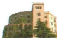
Castello Utveglio Palermo