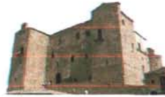
Castello Ventimiglia Castelbuono

Conosci te stesso per abbracciare l'umanità