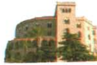
Castello Utveggio Palermo