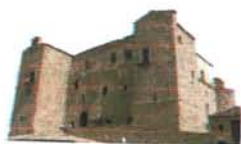
Castello Ventimiglia Castelbuono

Conosci te stesso per abbracciare l'umanità