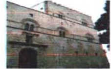
Palazzo Steri Palermo