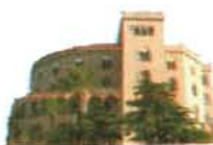
Castello Utveglio Palermo