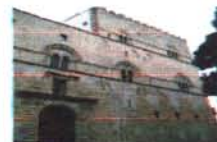
Palazzo Steri Palermo