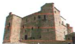
Castello Ventimiglia Castelbuono

Conosci te stesso per abbracciare l'umanità