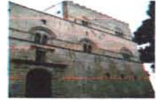
Palazzo Steri Palermo

La medicina d'urgenza istituita in Italia solo nel 1997 ed è collocata nell'area medica e delle specialità mediche.