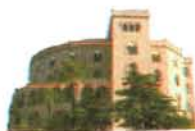
Castello Utveglio Palermo