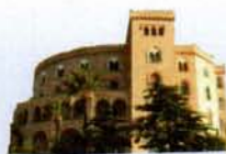
Castello Utveggio Palermo