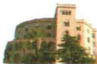
Castello Utveglio Palermo