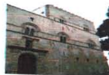
Palazzo Steri Palermo