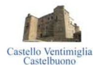
Castello Ventimiglia Castelbuono

Rotary International Club Palermo - Parco delle Madonie Distretto 2110 SICILIA - MALTA