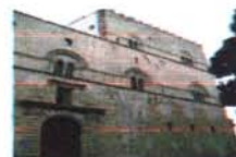
Palazzo Steri Palermo