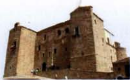
Castello Ventimiglia Castelbuono

Conosci te stesso per abbracciare l'umanità