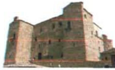
Castello Ventimiglia Castelbuono

Conosci te stesso per abbracciare l'umanità