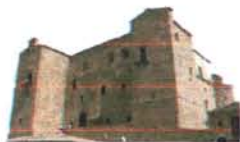
Castello Ventimiglia Castelbuono

Conosci te stesso per abbracciare l'umanità