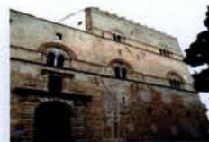
Palazzo Steri Palermo