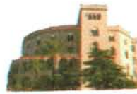
Castello Utveggio Palermo