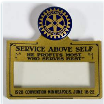
Il badge della Convention del Rotary International del 1928 con gli slogan del Rotary.

Gli slogan ufficiali del Rotary, "Servire al di sopra di ogni interesse personale" e "Chi serve gli altri ottiene i migliori profitti", risalgono ai primi anni dell'organizzazione.