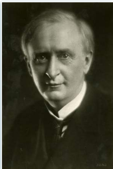
Arthur Frederick Sheldon, il cui discorso alla Convention ispirò il secondo slogan del Rotary: "Chi serve gli altri ottiene i migliori profitti".