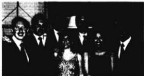
"I presidenti del Rotaract Catania Est"

Anche i nostri ragazzi da qualche tempo hanno superato il giro di boa dei dieci anni, molte facce sono cambiate, molti di loro sono usciti dal Club per limiti di età (30 anni), ma nei giovani del Rotaract Catania Est di oggi lo spirito di servizio che li anima è sempre lo stesso ed in molte occasioni dovremmo essere noi a prendere esempio da loro.