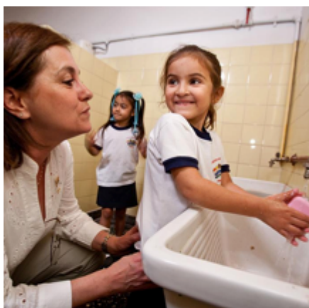
SFIDA WASH IN SCHOOLS

Il Rotary ha lanciato una sfida globale ai soci, chiedendo loro di lavorare insieme per migliorare la qualità e l'accesso all'educazione — in particolare per le ragazze — lavorando da vicino con le comunità per migliorare la formazione degli insegnanti, i piani di studi, gli impianti d'acqua, i servizi igienici e l'igiene.