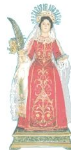
SABATO 18 GIUGNO Santa Marina