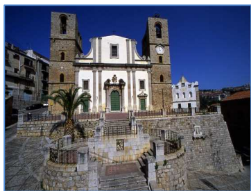
Caccamo Chiesa Parrocchiale SS. Annunziata