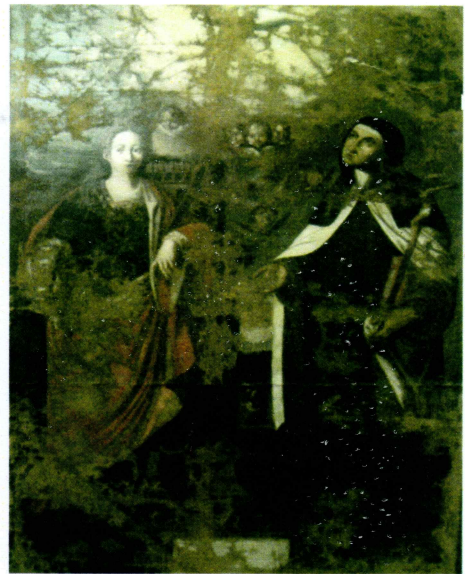
"Santa Barbara e Santa Teresa d'Avila" Olio su Tela, autore Ignoto sec. XVII - cm 140x240 h

Parrocchia Maria SS. Assunta Chiesa Madre - Piazza Umberto I Petralia Sottana