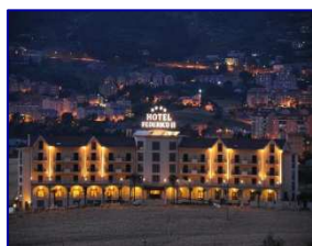
HOTEL FEDERICO II ENNA

Sabato 15 dicembre 2012 : ore 10,00 Enna, Hotel Federico II°.