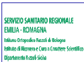
ISTITUTO ORTOPEDICO RIZZOLI DIPARTIMENTO - SICILIA