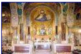
CAPPELLA PALATINA - PALAZZO REALE-

Lunedì 17 dicembre 2012: Ore 18,45 presso la Cappella Palatina a Palazzo Reale