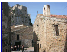
CHIESA S. ANTONIO ABATE CACCAMO

Sabato 1 dicembre 2012 : Ore 16,00 – Caccamo - Chiesa di S. Antonio Abate,