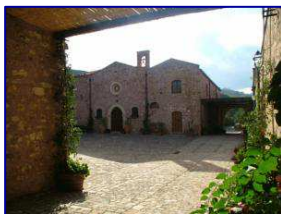
RELAIS SANTA ANASTASIA CASTELBUONO