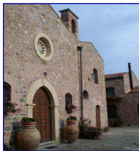
RELAIS SANTA ANASTASIA CASTELBUONO

Domenica 16 dicembre 2012 : Ore 11,00 Appuntamento con i soci presso il Relais Santa Anastasia di Castelbuono.