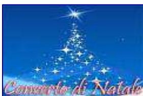
CONCERTI DI NATALE ROTARY AREA PANORMUS

Dal 26-12-2012 al 06-01-2013 : Concerti di Natale organizzati dall'Area Panormus.