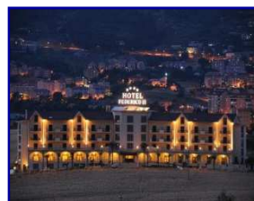
Hotel Federico II Enna