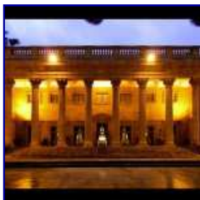
Palazzo Villarosa Bagheria

Venerdì 9 novembre 2012 : ore 19,30 Villarosa (Bagheria) il Club di Corleone in interclub con