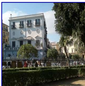
Palazzo Fatta Palermo