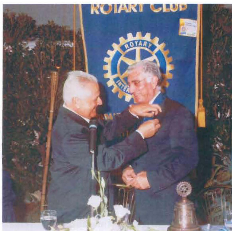
Passaggio della Campana.