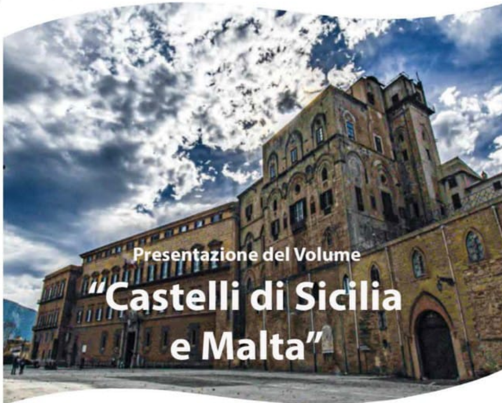
Palermo - Palazzo dei Normanni

28 Luglio 2022 - ore 19.00 Giardini Reali Palazzo dei Normanni - Palermo