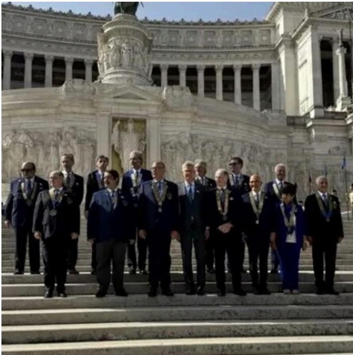
L'omaggio dei Governatori del Rotary all'Altare della Patria

Cerimonia con i Distretti di tutta Italia, l'impegno per la pace